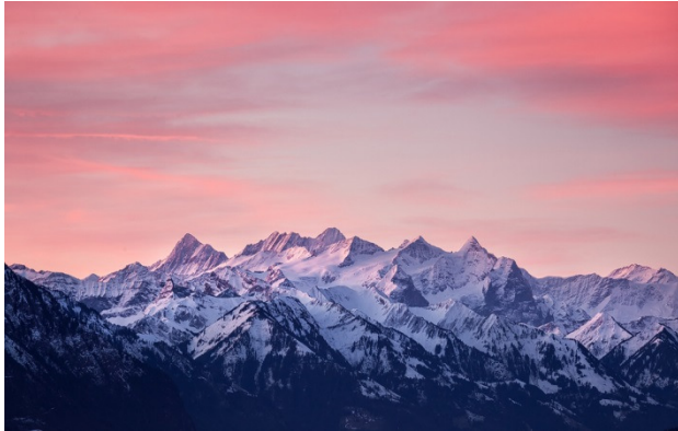
Trittst im MORGENROT daher