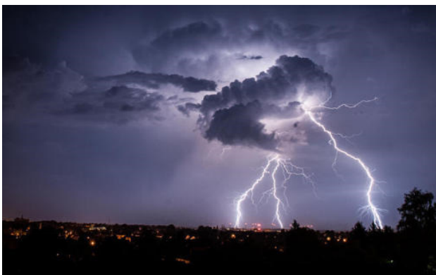
Fährst im WILDEN STURM daher