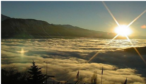
Ziehst im NEBELFLOR daher