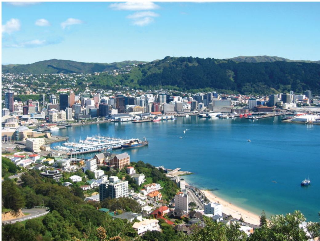
Wellington, die Hauptstadt Neuseelands

Bei offiziellen Anlässen wird nur die jeweils erste Strophe (erst in Māori, dann in Englisch) gesungen: